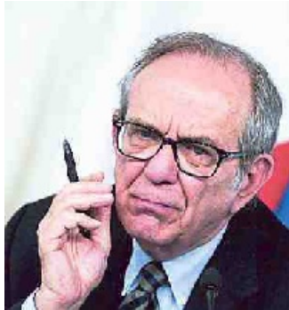
Pier Carlo Padoan